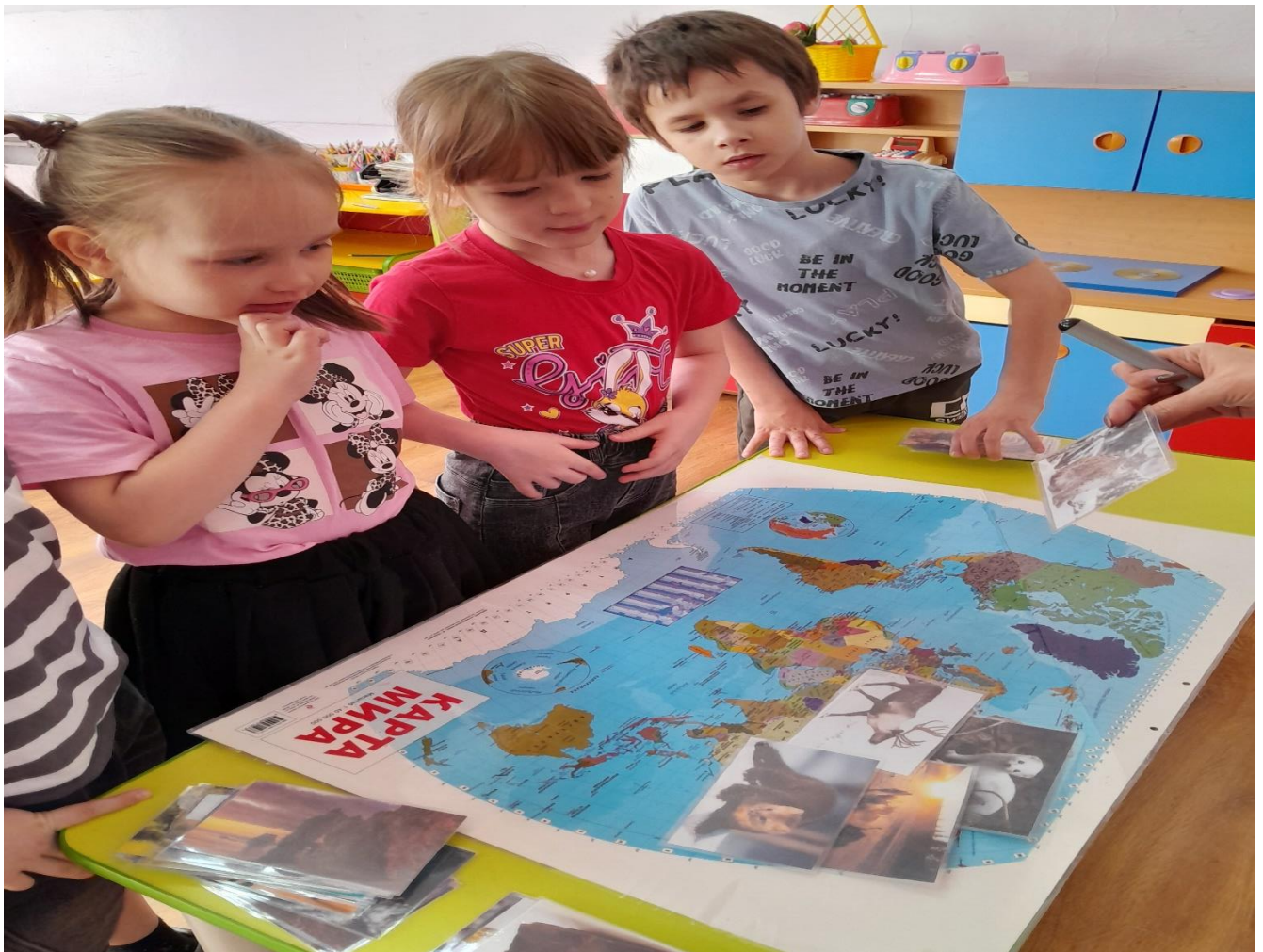
Сохраним планету Земля! «Животные России»