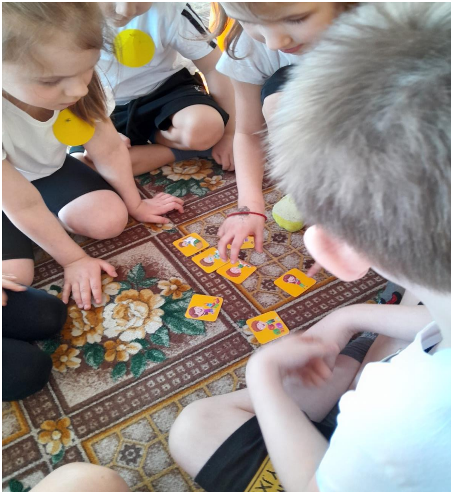
Советы воспитанникам по сохранению здоровья.