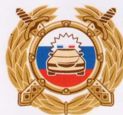
Госавтоинспекция МВД России

Буклет изготовлен по заказу Минпросвещения России в рамках реализации федеральной целевой программы «Повышение безопасности дорожного движения в 2013–2020 годах».